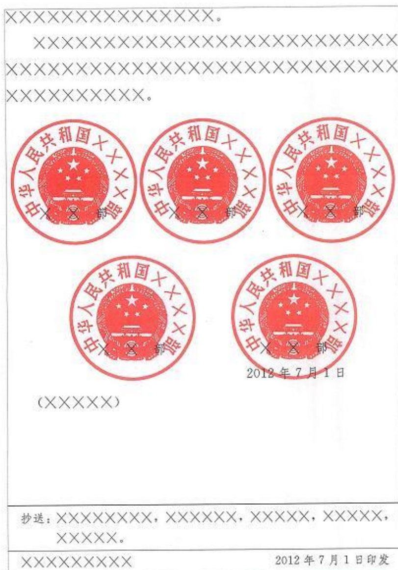
图 8 联合行文公文末页版式 2